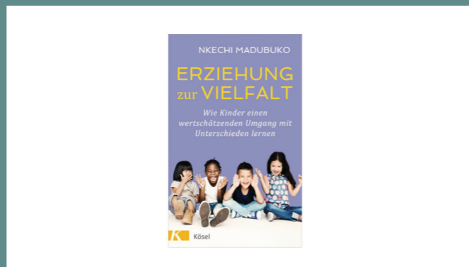
„Erziehung zur Vielfalt: Wie Kinder einen wertschätzenden Umgang mit Unterschieden lernen“ von Nkechi Madubuko

Das Buch erklärt, woran Offenheit oft scheitert. Es zeigt Ihnen als Eltern und Bezugspersonen Wege auf, Kindern in der Erziehung eine wertschätzende Haltung gegenüber Vielfalt zu vermitteln.