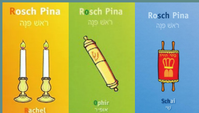
„Rosch Pina. Jüdisches Lehrbuch, Band I-III“ von Sylvia Dym

Das ist eine dreiteilige Reihe von Lernbüchern für den jüdischen Religionsunterricht. Band I richtet sich an Kinder von 6 bis 8 Jahren, Band II an Kinder von 8 bis 10 Jahren und Band III an Kinder von 10 bis 13 Jahren.